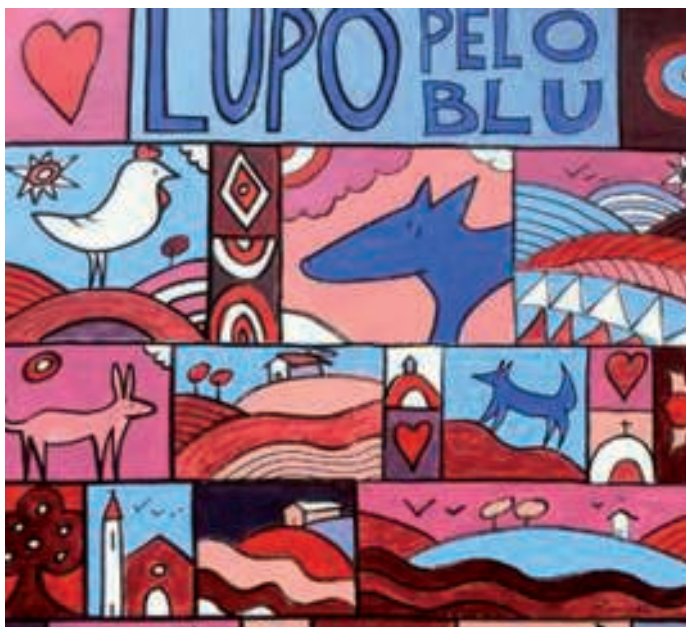
Coloratissimo. Uno dei murales comparsi sui muri di Montelupo Albese