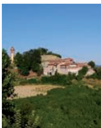
Amena località. Uno scorcio del piccolo abitato di Arguello

Sono stati confermati valori dell'Imu (l'imposta sugli immobili) e dell'addizionale Irpef sui livelli del 2013 e 2014. Oltre a