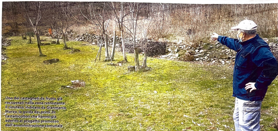
Uno dei castagneti da frutto già recuperati nella zona retrostante il cimitero, indicato da Gianmarco Marzo, la guida dei primi 20 castanicoltori che hanno già aderito al progetto promosso dall'amministrazione comunale